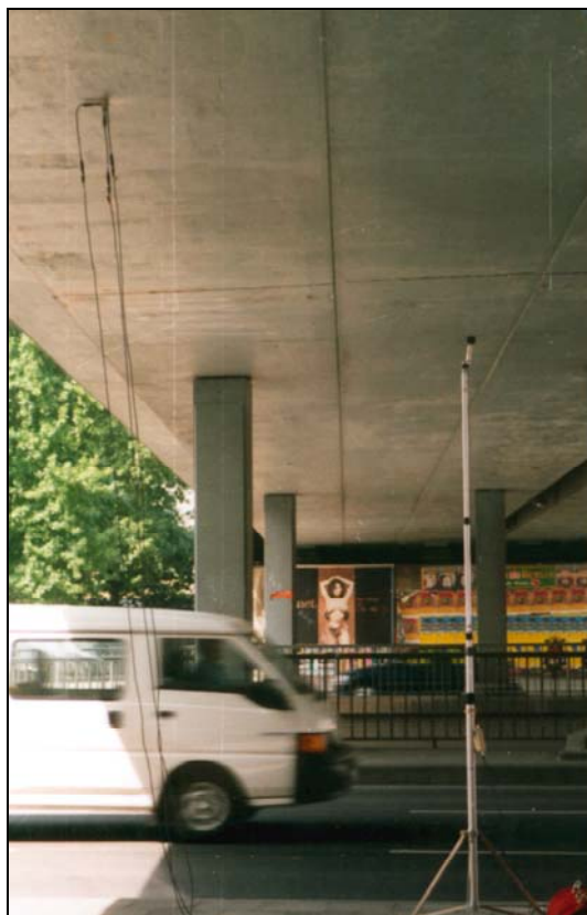
Bild rechts: Messanordnung der Schwingungsaufnehmer und des Mikrofons für den abgestrahlten Luftschall unter einer Eisenbahnbrücke